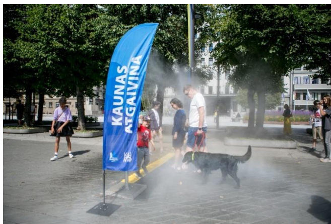
Vandens dulksnos sistema Laisvės al.

Birželio mėn. priimtas sprendimas Bendrovės galimybių ribose skirti 3 tūkst. eurų finansinę paramą asociacijai „RAUDONOS NOSYS Gydytojai klounai", padedančiai sergantiems vaikams.